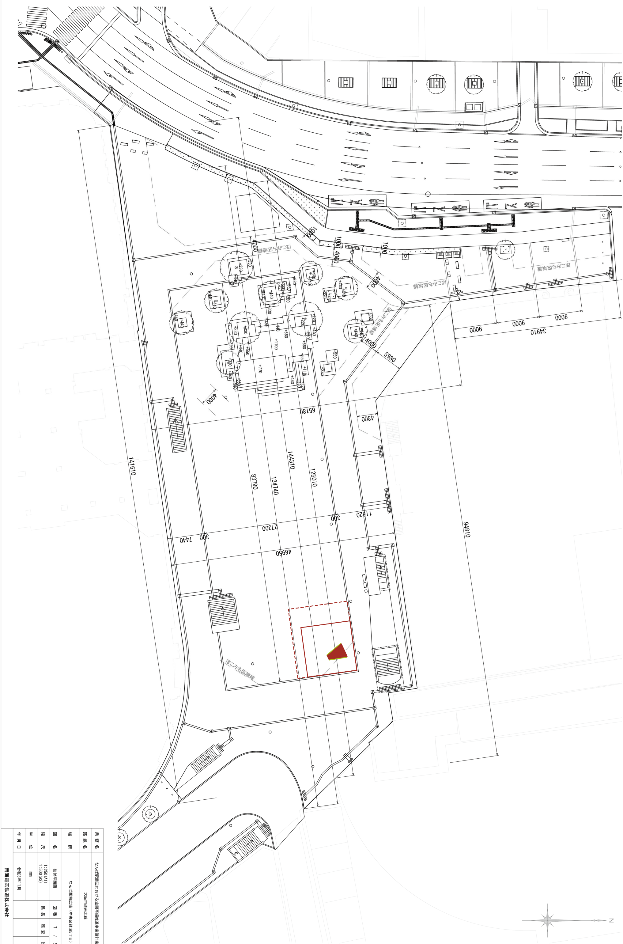
割付平面図 S=1:500 (A3)